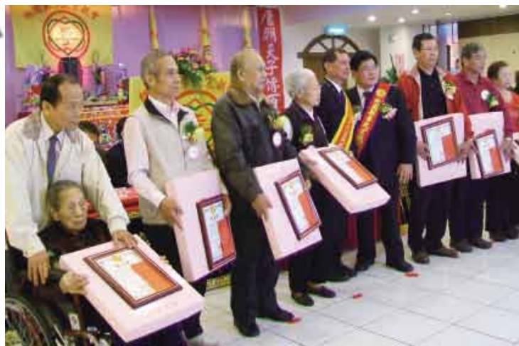
頒發「重陽敬老」的壽狀及賀儀