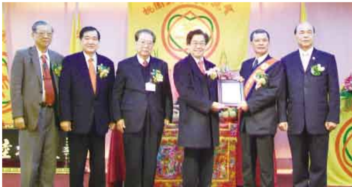
常盛事長長(右3)代表世界李氏宗親總會致贈紀念牌給鎮楠宗長(右2)