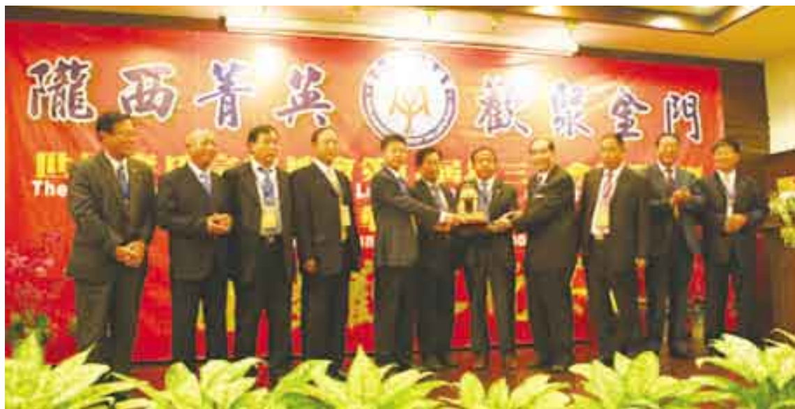
2010年10月28日贈世界李氏宗親總會「唐祖陵石獅」工藝品(如上圖)

2010年10月28日、29日，我們「隆堯縣華夏李氏宗親聯誼會」出訪團和「邢臺市李氏宗親聯誼會」代表團，共同參加了「世界李氏宗親總會」在金門舉辦的「第13屆第3次會員代表大會暨2010年全球李氏懇親大會」；參加大會的有來自世界各地