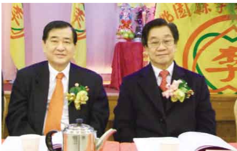
常盛理事長(右)與印尼的振強會長連袂出席桃園縣大會

「桃園縣李氏宗親會成立29週年慶、祭祖」暨「第11屆第1次會員代表大會及第10、11屆新舊任理事長交接典禮」於2010年12月19日上午，假桃園縣蘆竹鄉萬翔餐廳舉行。除了大會主席「桃園縣李氏宗親會第10屆