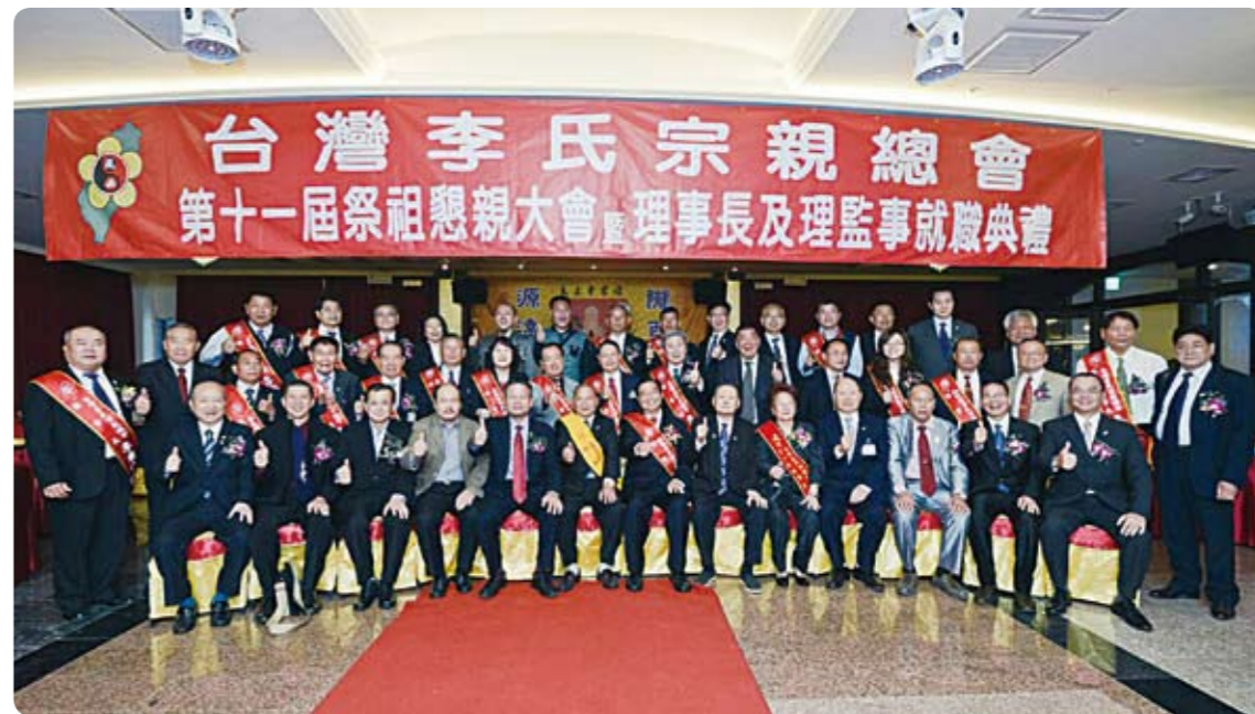
2015年3月28日上午，台灣李氏宗親總會舉辦「第11屆理事長暨理監事就職典禮」，各方來賀的嘉賓們合影留念。