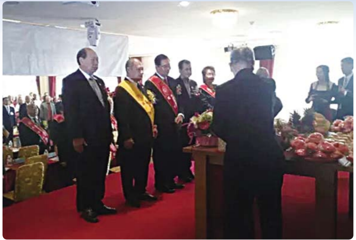
大會開始之前，首先舉行「祭祖典禮」，以表達對先祖的崇敬與感懷。