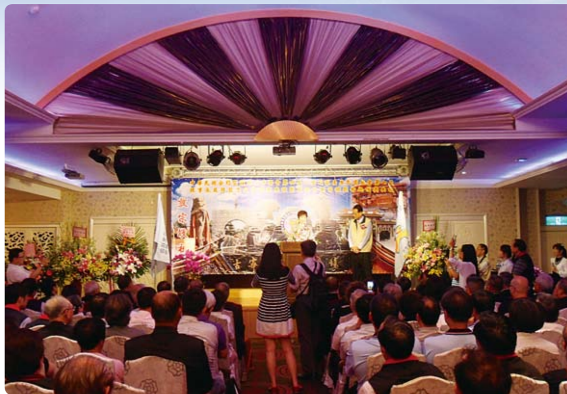
2015年5月3日，「金門旅台李氏宗親會」在新北市蘆洲區的「富基婚宴會館-蘆洲會館」舉行「第7屆理事長交接就職典禮」。

立法院洪秀柱副院長於百忙中，亦應邀蒞臨致詞；她除了祝賀「金門旅台李氏宗親會」李錫敏理事長及理監事之外，也同時指出——「金門」代表著「不畏懼、不怕挫折、奮戰不懈」的精神，她期許自己以這種精