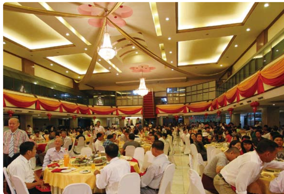
2015年1月10日「旅緬隴西堂」盛大舉辦「慶祝托塔天王聖誕千秋」聯歡宴會